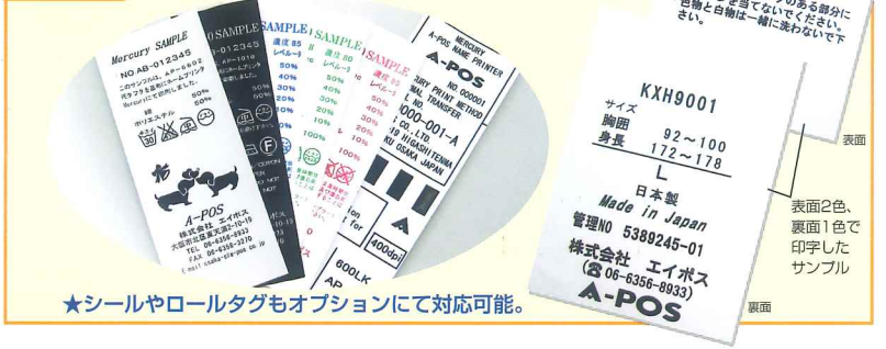
★シールやロールタグもオプションにて対応可能。